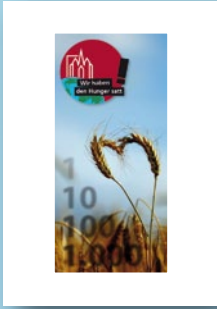
Flyer-Leporello „Wir haben den Hunger satt!“