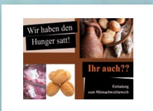
Einladungsklapp- karte zum Mitmachwettbewerb