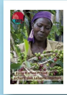
Aktionsplakat „Faire Kaffeepreise“