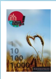
Rahmenplakat „Wir haben den Hunger satt!“