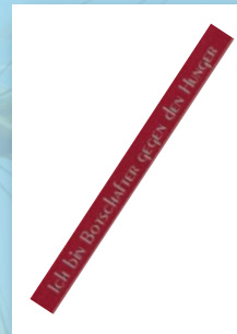
Solidaritätsbändchen „Ich bin Botschafter gegen den Hunger in der Welt“