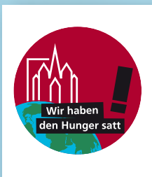
Aufkleber 10 cm