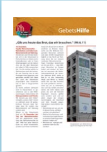
Gebetshilfe zum Tag der Menschenrechte