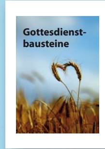
Gottesdienstbausteine „Brot verwehren? – Brot verehren. – Brot vermehren!“ (ab Ostern'14)